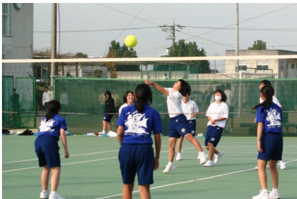
1年女子 ソフトバレーボール