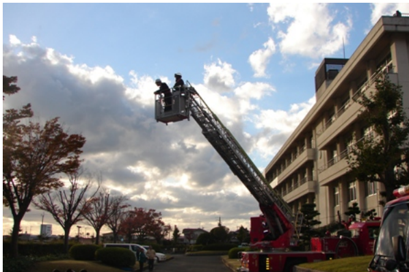
はしご車体験（3年生）