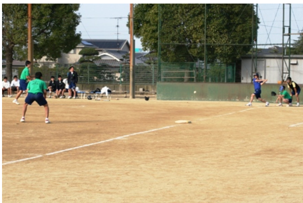
2年男子 ソフトボール