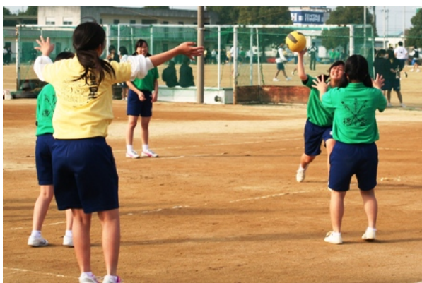
2年女子 ドッジボール