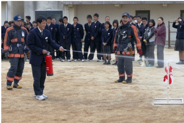
初期消火体験（1年生）

その後、1年生は初期消火体験を行いました。また、2年生は起震車を利用して東日本大震災の揺れを実感しました。3年生を利用して屋上からの避難訓練を体験しました。